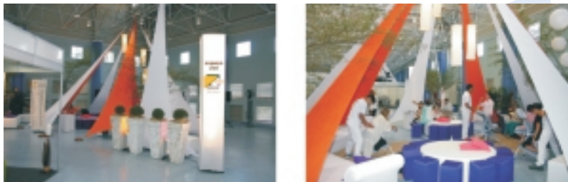
Exemplo de Espaço Zen. Utilizado em Congresso da AB Eventos.