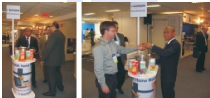
Carrinhos utilizados no 35º Congresso da SBCCV – SP.